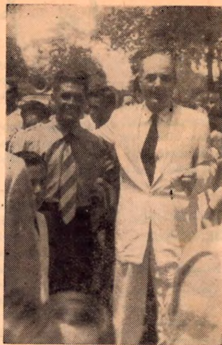
El señor Presidente de la república en amena charla con el Director de esta revista, conversan acerca de los problemas que afectan a Puntarenas y a los cuales el Gobierno del señor Echandi ha ofrecido dar solución.