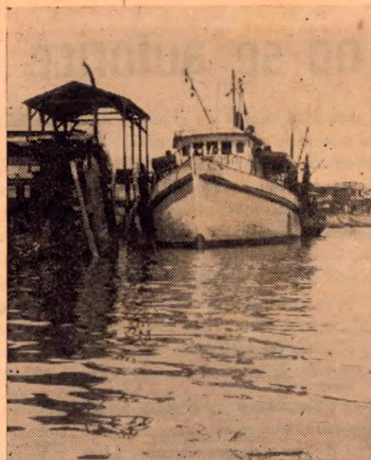
El pesquero "Santa Rosa" en labores de descarga en el puerto

No seguiremos gastando energías en dolernos de nuestras estrecheces. Sigue en pág. 28