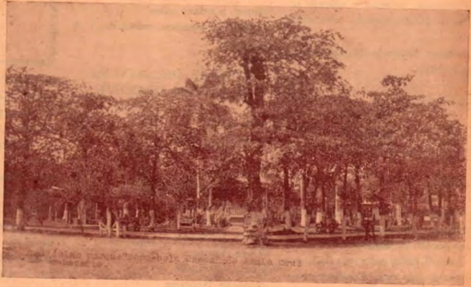
El precioso parque "Bernabela Ramos" de Santa Cruz, tiene un aspecto selvático que lo hace ser un sitio encantador para el turismo que visita la ciudad.

En la historia de Guanacaste se cita el informe de la misión apostólica del Obispo don Pedro Agustín Morel de Santa Cruz, como magnífica fuente informativa, por la abundancia de sus datos y descripción en él; y cuando se habla de San Juan de Indiriá, pueblo formado en su mayor parte de ladinos, nadie lo relaciona sino con el nacimiento del pueblito de Guanacaste, hoy ciudad de Liberia. De tal suerte, que es claro y terminante de que Santa Cruz de Guanacaste no existía para el tiempo del descubrimiento y la conquista