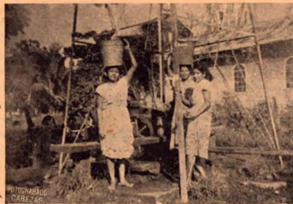
Muy pronto los santacruceños tendrán cañería y ya no tendrán las amas de casa que ir por el agua a la Bomba del Pozo artesiano, como se ve en esta instantánea.